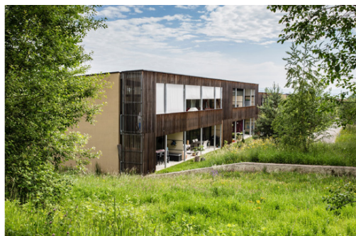
Lotissement «PIC», Allschwil